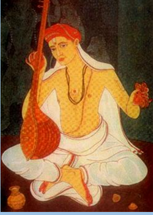
The Composer Tyagaraja